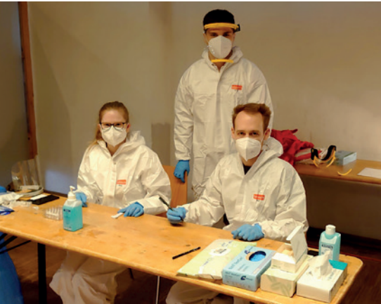
Danke: Vorbildliches Engagement zum Wohle der Allgemeinheit!