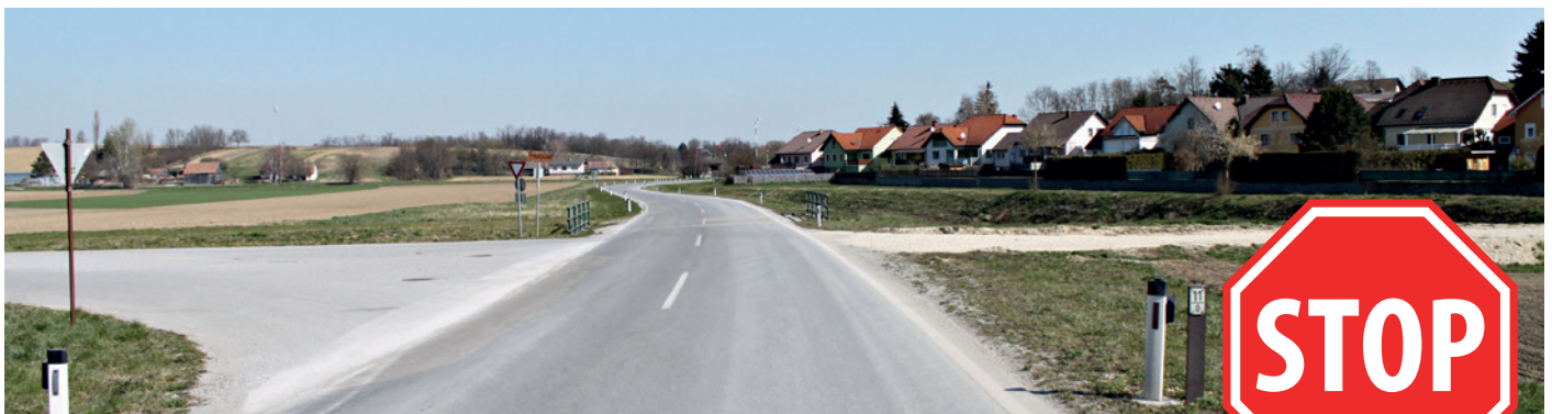
Beide Güterwege der Kreuzung Richtung Matzen sind, nach Überprüfung der Behörde, mit einem „Stop“-Verkehrszeichen zu beschildern.

■ Im November 2019 trat die Gemeinde Spannberg mit einem Antrag zur Anberaumung einer Verkehrsverhandlung an die Bezirkshauptmannschaft Gänserndorf heran. Die Situierung einer 70 km/h-Beschränkung vor der Ortseinfahrt Spannberg von Matzen kommend, wurde seitens der Gemeinde angestrebt, zumal eine Querung aus dem Ortsbereich in die L18 mündend, primär für Zwecke des landwirtschaftlichen Schwerverkehrs, errichtet wurde.