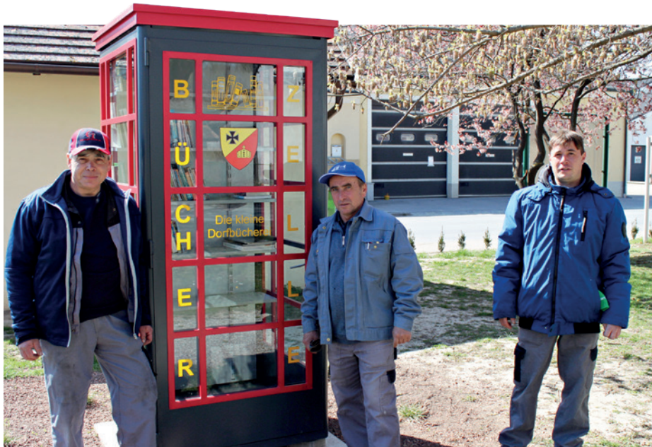
Mit viel Liebe zum Detail verwandelte unser Bauhof-Team eine Telefonzelle in unsere neue „Bücherzelle“.

■ Telefonzellen haben ausgedient? In Zeiten der Smartphones meistens – aber nicht immer.