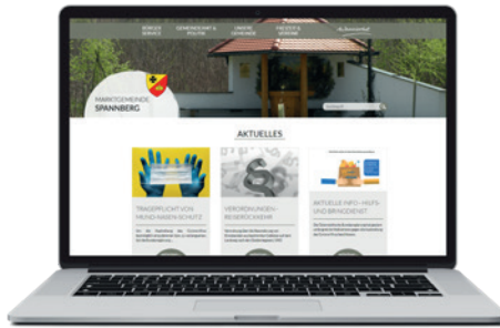
Aktuelle Informationen aus und rund um Spannberg erhalten Sie auf www.spannberg.at

Das „WWW“ dient in der heutigen Zeit als eines der wichtigsten Informationsmittel, auf dessen Existenz nicht verzichtet werden kann. Hier können wir Ihnen aktuelle Informationen zukommen lassen, Veranstaltungen bekannt geben, unsere Vereine und dessen Tätigkeiten vorstellen, oder Spannbergs Wirtschaft präsentieren. Das