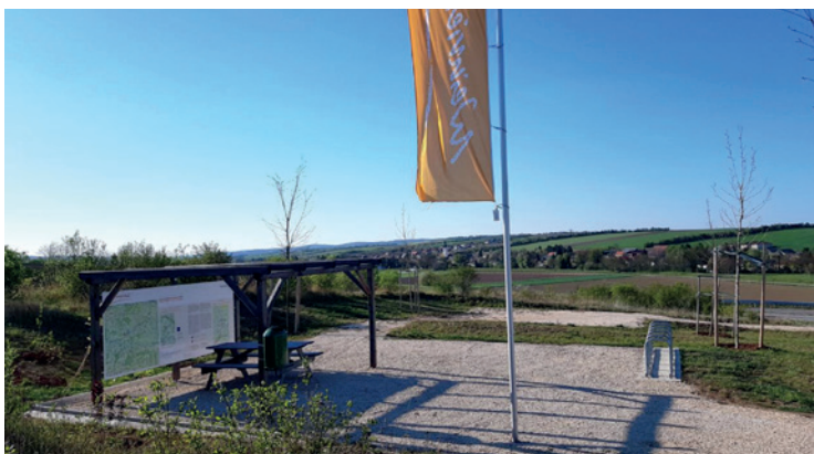
Mit dem Ziel, mehr Weinviertel-Rastplätze an Rad-, Wander- und Pilgerwegen zu realisieren, soll auch in Spannberg ein solcher Rastplatz geschaffen werden. (Symbolfoto)

Der Platz wird neu adaptiert und mit einer schattenspendenden Überdachung ausgestattet. Die Fertigstellung ist bis Ende 2020 geplant. Der Platz soll für alle Generationen in Spannberg zum gemütlichen Verweilen einladen.